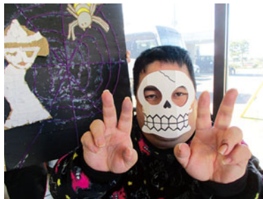
トリック・オア・トリート!