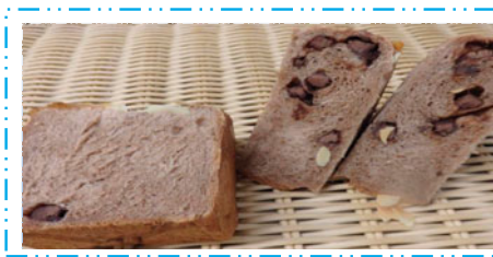
ロッシュショコラ ¥200 (厚さ4.5cm)