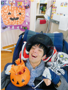
ハッピーハロウィン