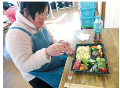
豪華弁当やったー!