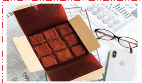
生チョコ ¥400 (9個入り)