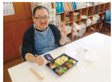
美味しいお弁当で笑顔!