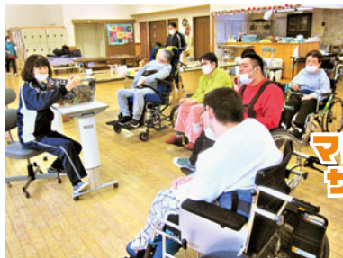
楽しい話し?怖い話し?