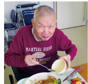
職員がUberEatsになり♪ 美味しいものをお届け♪