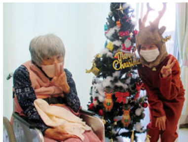
🎄トナカイとマリークリスマス🎄