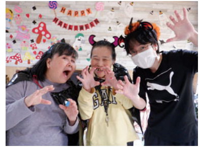
trick or treat!!