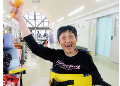
実習生さんに 絵本を読んでもらっています♪