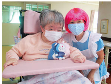
ハッピー♡ハロウィン