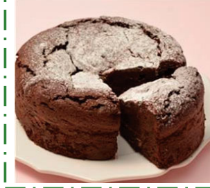
ガトーショコラ ¥1000 (5号15cm箱入り)