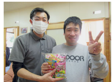
秋覚祭 昼食とミニゲーム