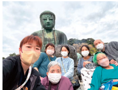
矢指ハウス～神奈川～