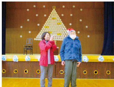
これからクリスマス会を始めます