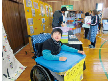
～きらら祭～ 販売をしました♪ ドキドキワクワク♪