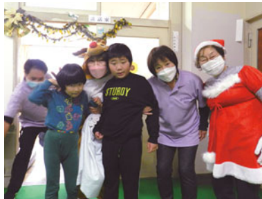
サンタとトナカイと♡