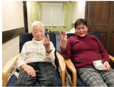
令和4年度 各ハウス泊旅行