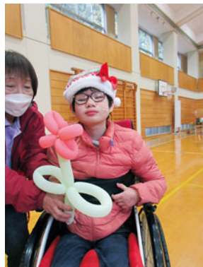
わたしのはお花よ