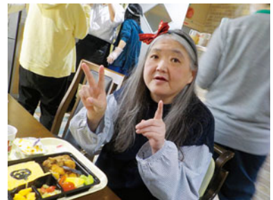
Halloween弁当も 美味しかった☆