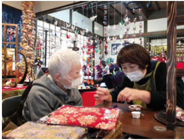
大貫ハウス～山梨・静岡～