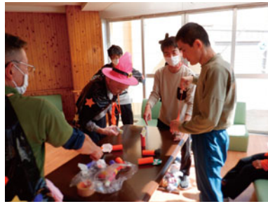
ゲームをして遊んだよ(^)/