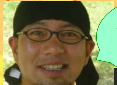
こひやま 小松山さん プロデュース だよ (*^_^*)